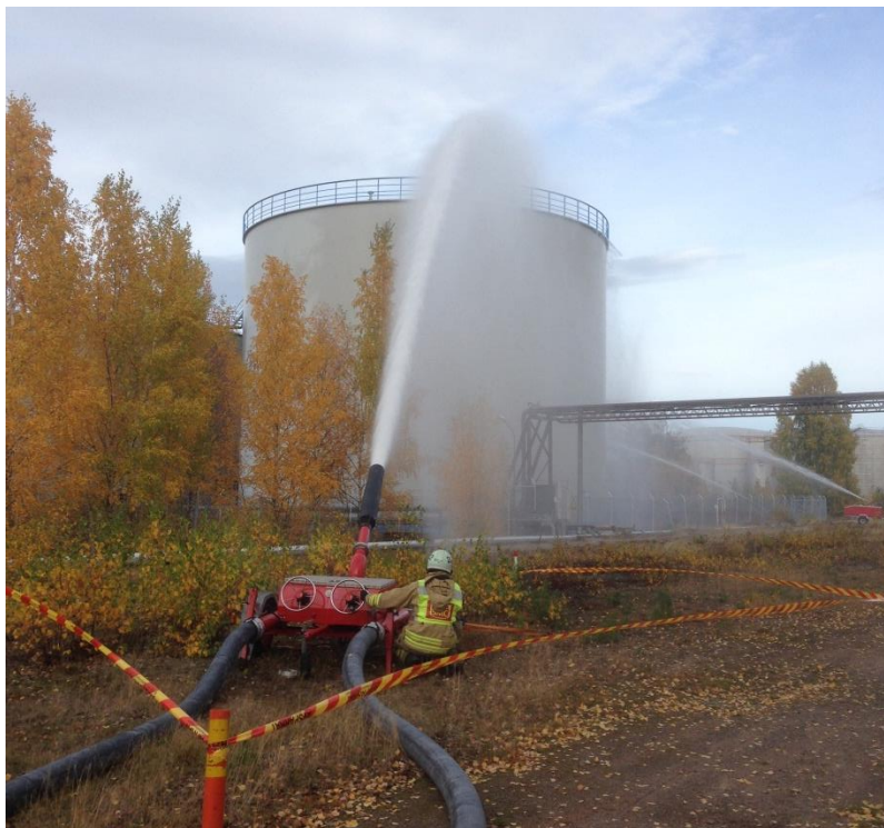
Bild 2. Övning tillsammans med SMC på St1 Sverige AB

Vid rörläckage i olika sammanhang som leder till brand kommer Räddningstjänsten Karlstadsregionen i första hand att rädda personer i omedelbar fara. Därefter kommer arbetet med att förhindra brandspridning och släckning av branden att påbörjas.