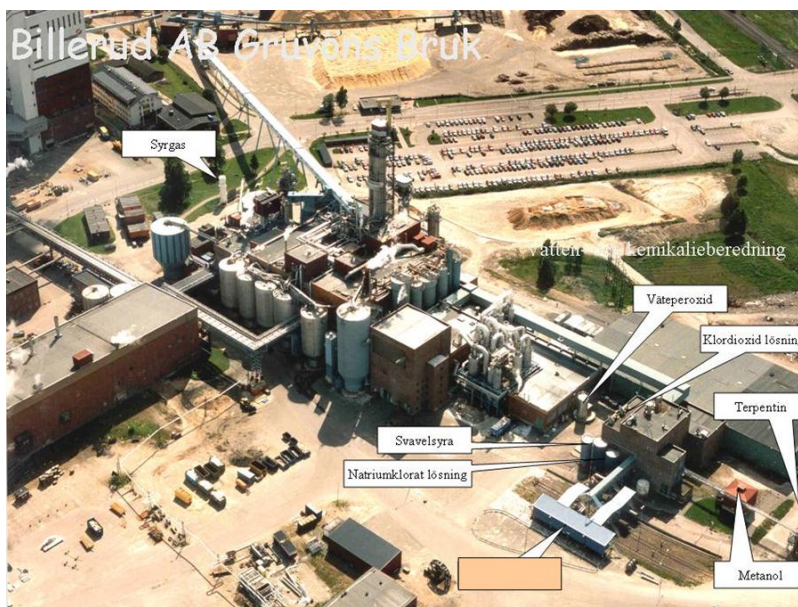
Bild 2. Översikt över kemin vid Billerud AB Gruvöns Bruk

I andra hand kommer räddningstjänsten att stoppa eller begränsa fortsatt utflöde samt ventiler eventuell uppkomst av explosiv och giftig kloridioxid.